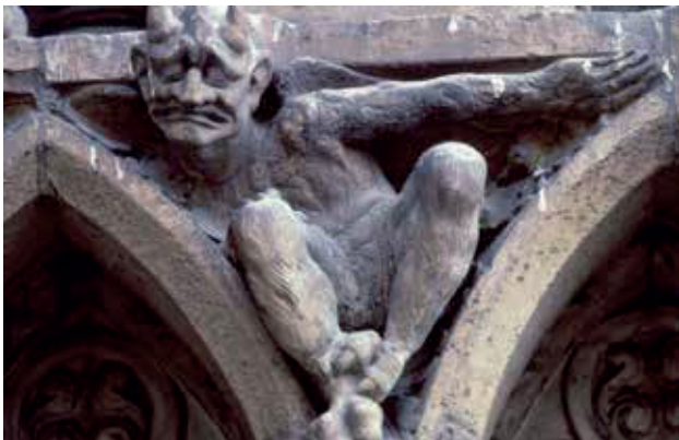
Le patrimoine bâti peut être dégradé par la pollution atmosphérique.

La pollution de l'air salit et dégrade les matériaux et les bâtiments : formation de croûtes noires sur les façades, dissolution des pierres, notamment calcaires, sous l'effet des pluies acides... Les atteintes au patrimoine bâti sont parfois irréversibles et de coûteux travaux de ravèlement et de rénovation sont nécessaires.