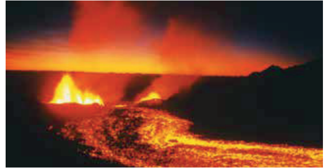
Des gaz et des particules sont émis lors d'éruptions volcaniques. Éruption du Piton de la Fournaise à la Réunion en 2009.