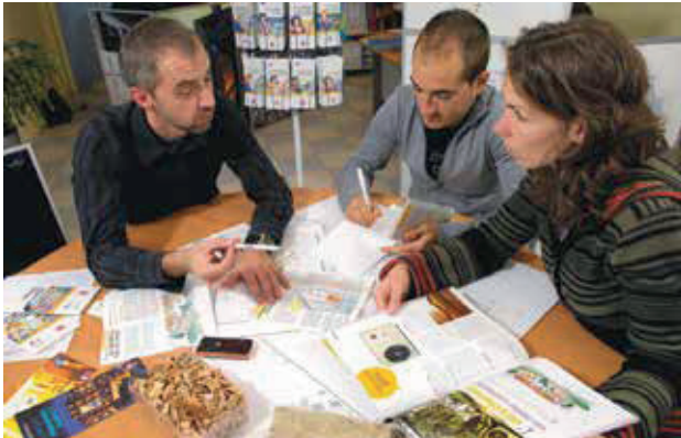
Les conseillers des Points rénovation info service vous reçoivent pour vous aider à monter votre projet de rénovation.

rejets domestiques de polluants ; • informe, accompagne et conseille les particuliers dans leur choix de systèmes de chauffage performants et peu polluants ; • encourage le renouvellement des appareils de chauffage au bois non performants.