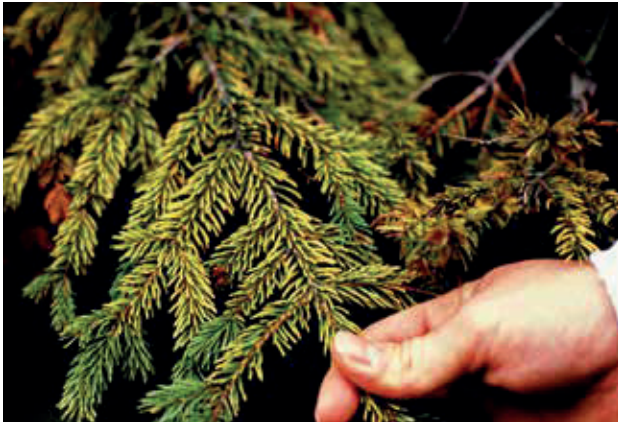
Jaunissement des aiguilles de conifères dû aux pluies acides.

Les dommages visuels dus aux effets à court terme de l'ozone sont aussi une gêne notable sur la valeur marchande des plantes cultivées sensibles à l'ozone.